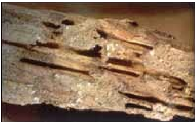
Dégâts sur pièce de charpente

Etat Parasitaire (termites, insectes, champignons) :